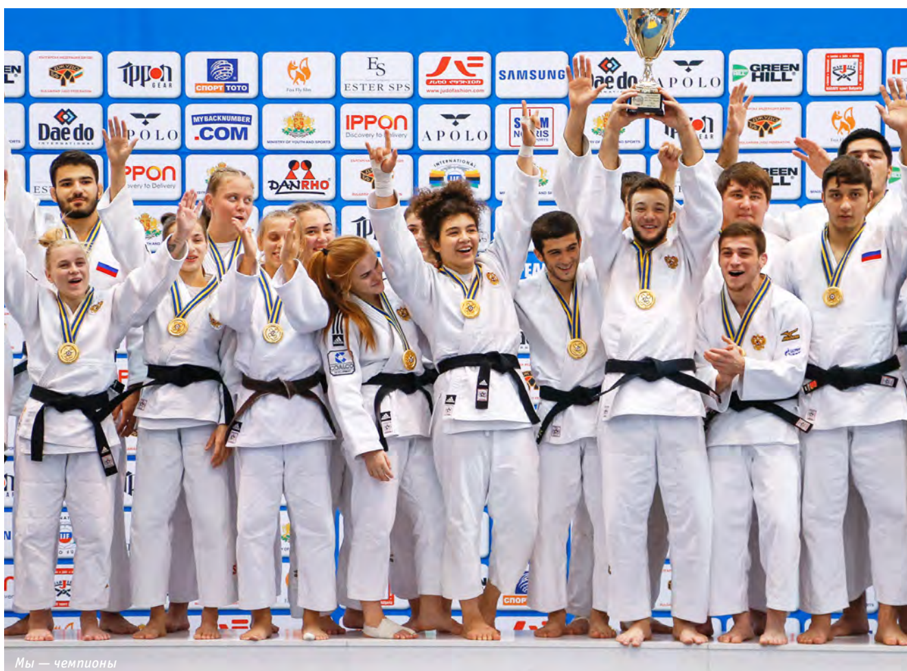
Мы — чемпионы