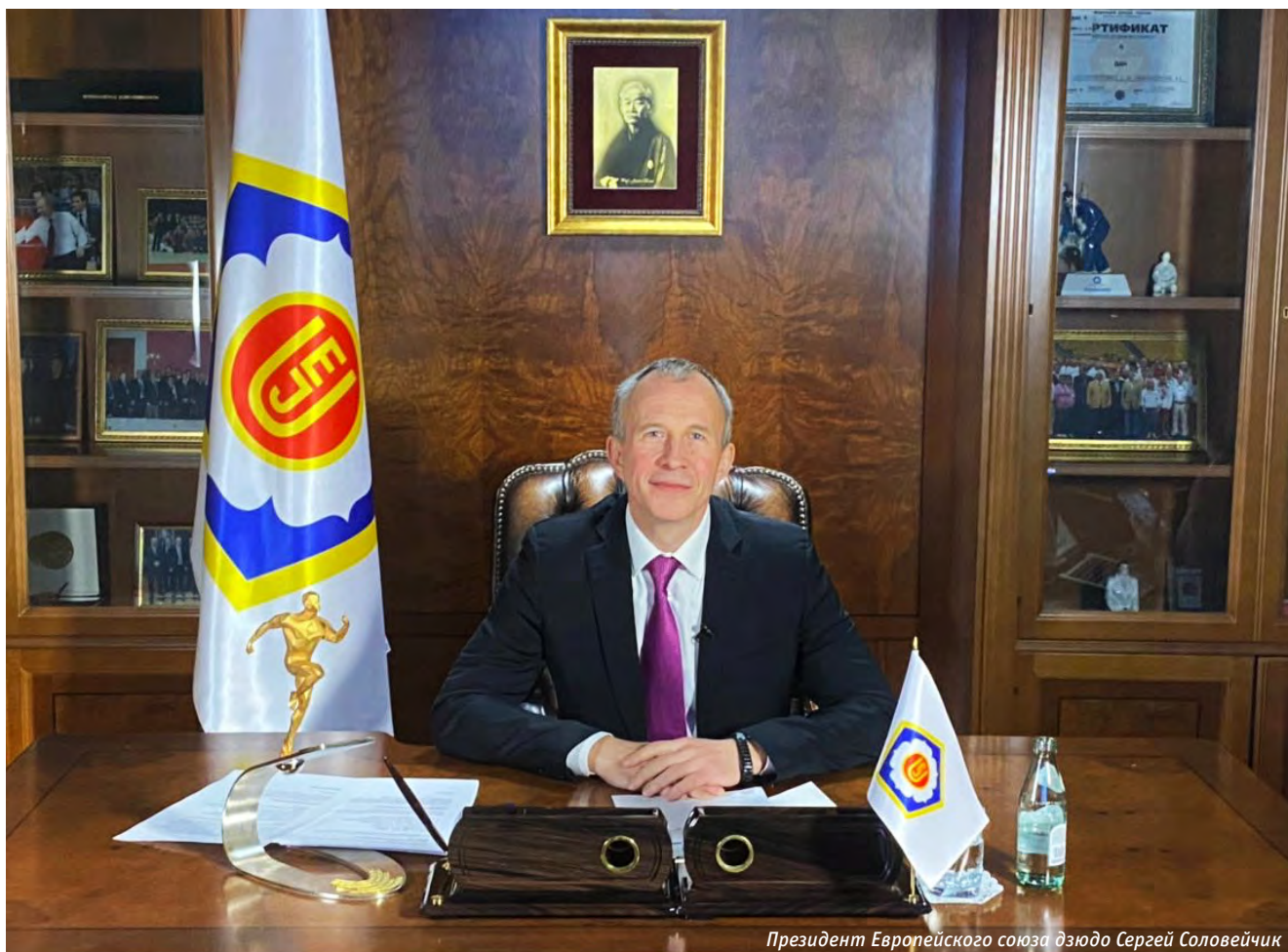
Президент Европейского союза дзюдо Сергей Соловейчик

удалось провести несколько важных соревнований. Если к отмене многочисленных кубков Европы спортсмены, тренеры и болельщики относились с пониманием, то отказ от рейтингового для квалификации на Игры в Токио чемпионата несомненно был бы воспринят болезненно. И ЕСД провёл главный турнир календаря. Провёл при соблюдении беспрецедентных мер безопасности. Теперь этот опыт европейцев с энтузиазмом изучают коллеги с других континентов и видов спорта. Прошли в Европе и два первенства — среди юниоров до 21 года и молодёжи до 23 лет.