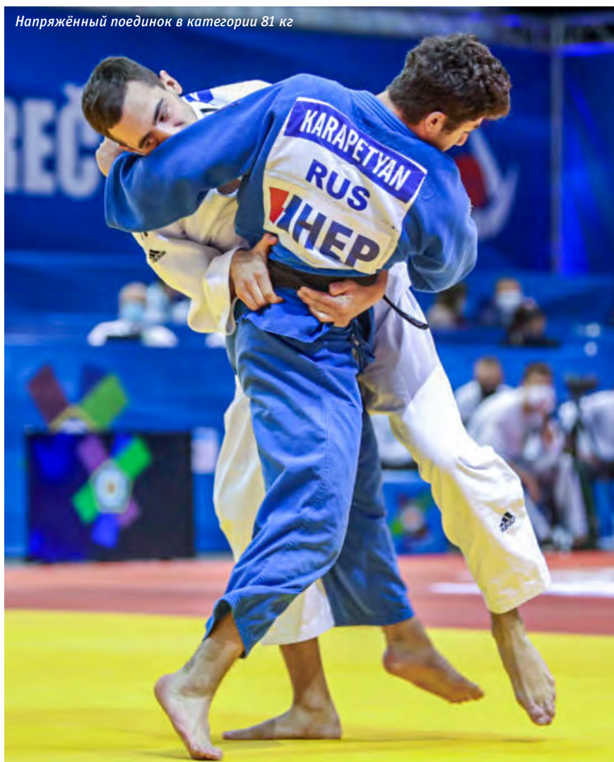
Напряжённый поединок в категории 81 кг