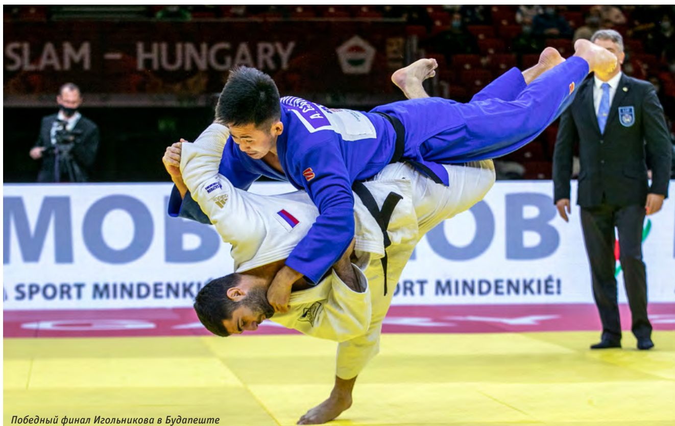
Победный финал Игольников в Будапеште