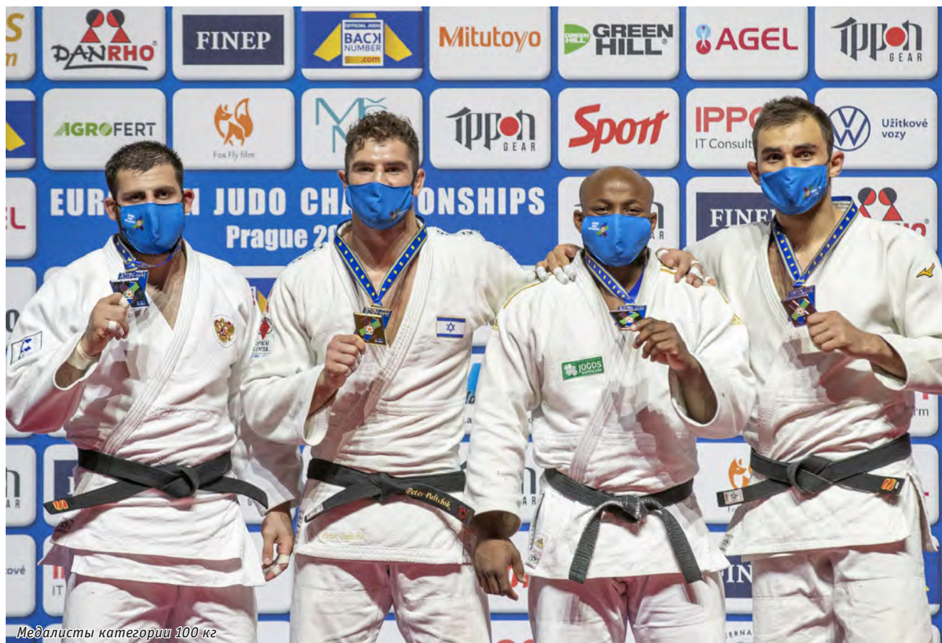
Медалисты категории 100 кг

сти на высоком уровне состязания в Праге. И, конечно, огромное спасибо всем нашим болельщикам за то, что верили в нас и поддерживали на всех этапах.