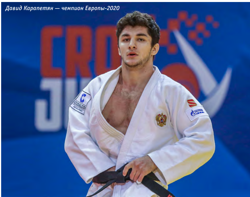
Давид Карапетян — чемпион Европы-2020

Вице-чемпион мира-2019 среди юниоров Давид КАРАПЕТЯН закономерно являлся фаворитом в категории 81 кг и с первой схват-