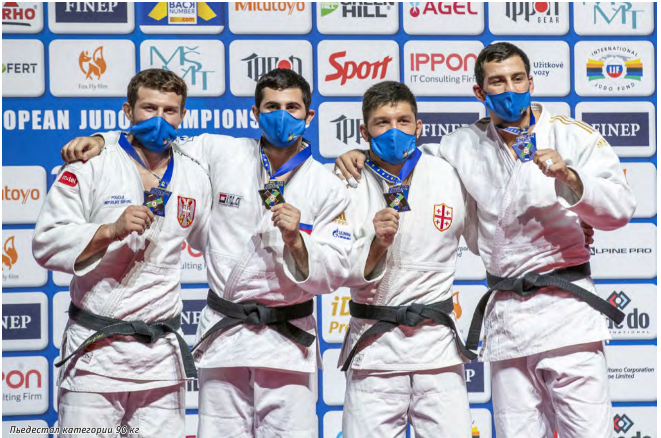
Пьедестал категории 90 кг