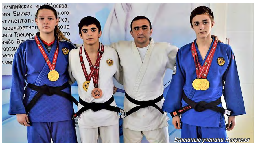
Успешные ученики Нагучева