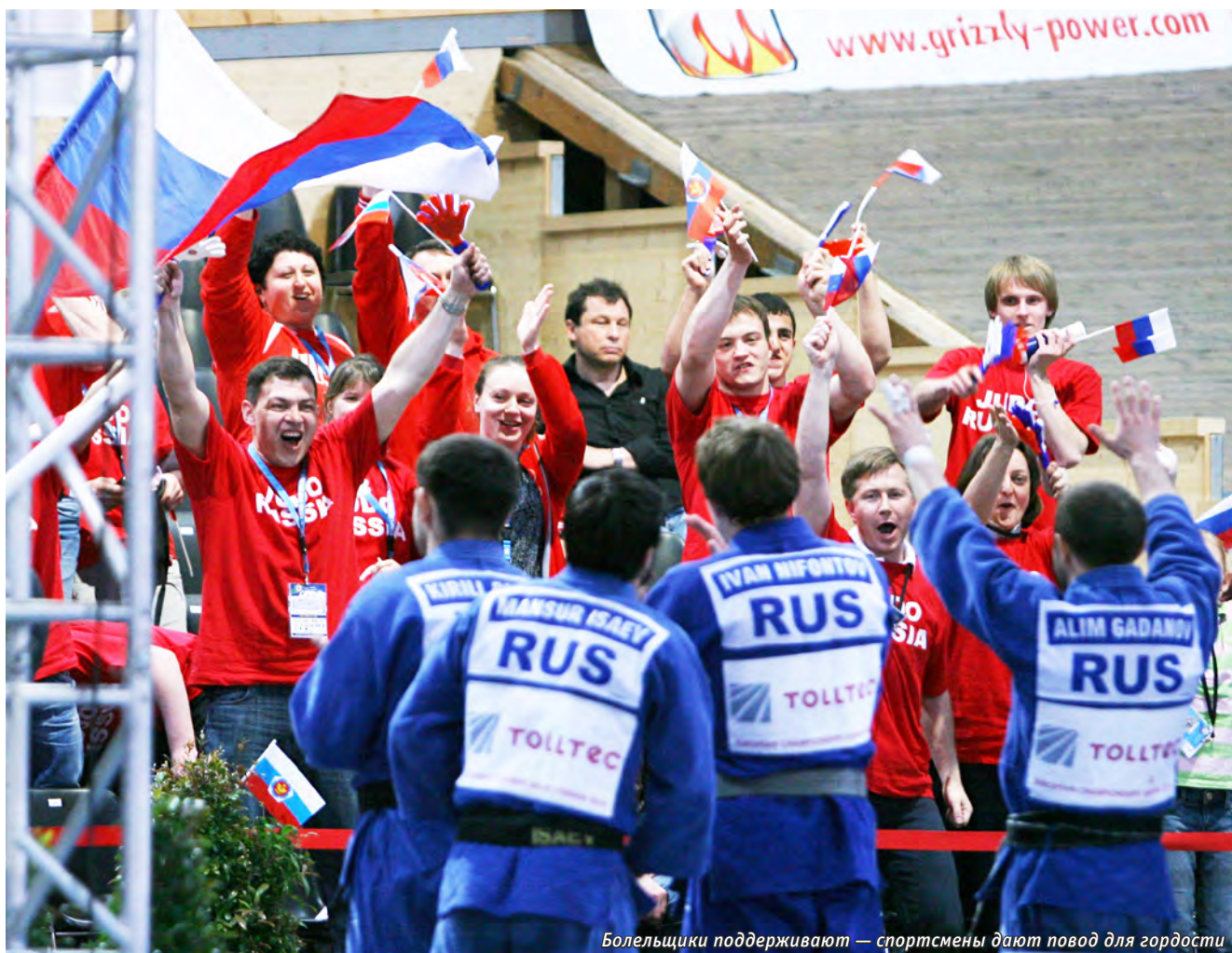
Болельщики поддерживают — спортсмены дают повод для гордости