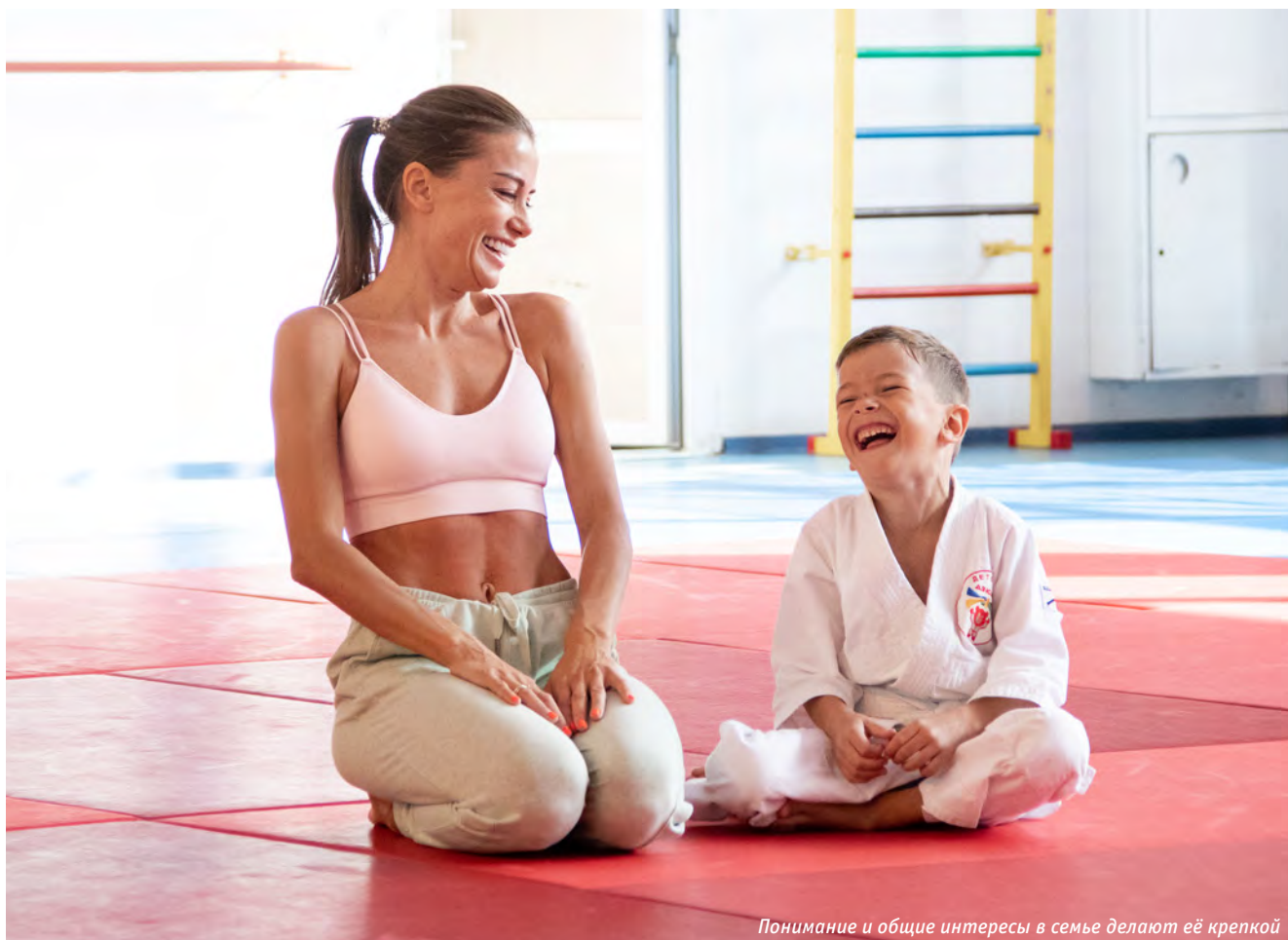
Понимание и общие интересы в семье делают её крепкой