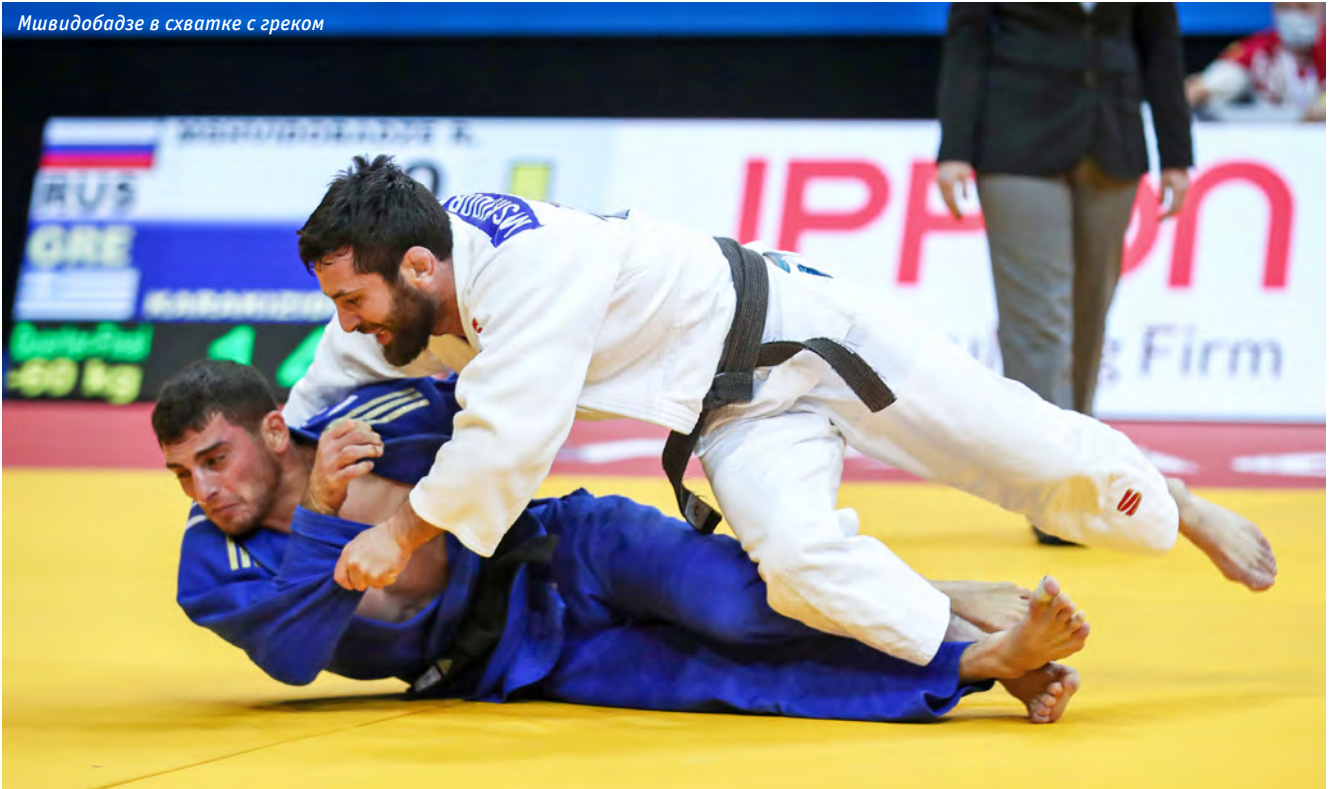
Мшвидбадзе в схватке с греком

шей среди всех европейцев позицией в рейтинг-листе IJF — пятой строчкой, обеспечившей ему место