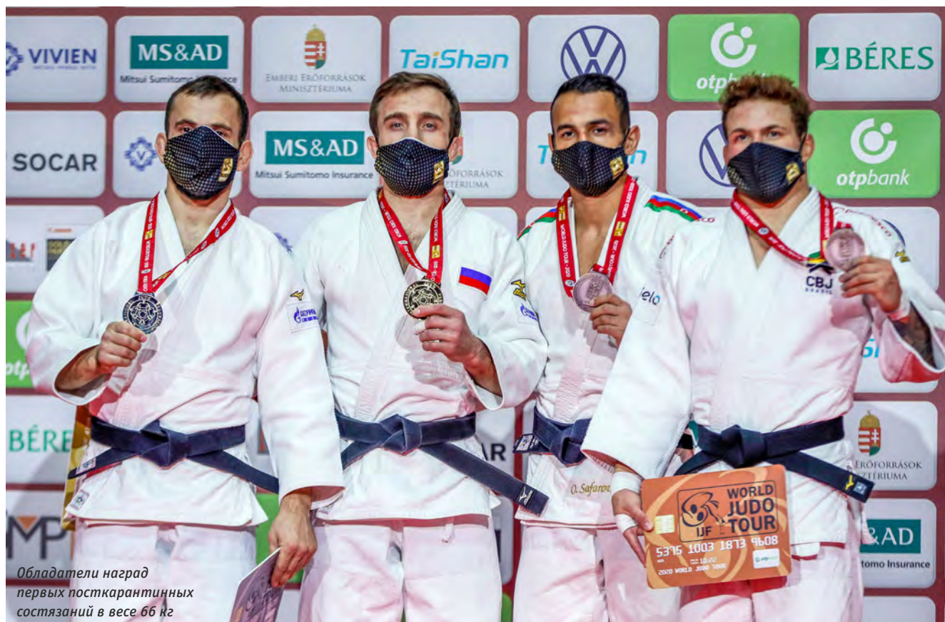
Обладатели наград первых посткарантинных соревнований в весе 66 кг

«Финальная встреча стала самой тяжёлой на этом турнире. Во многом потому, что мы с Робертом