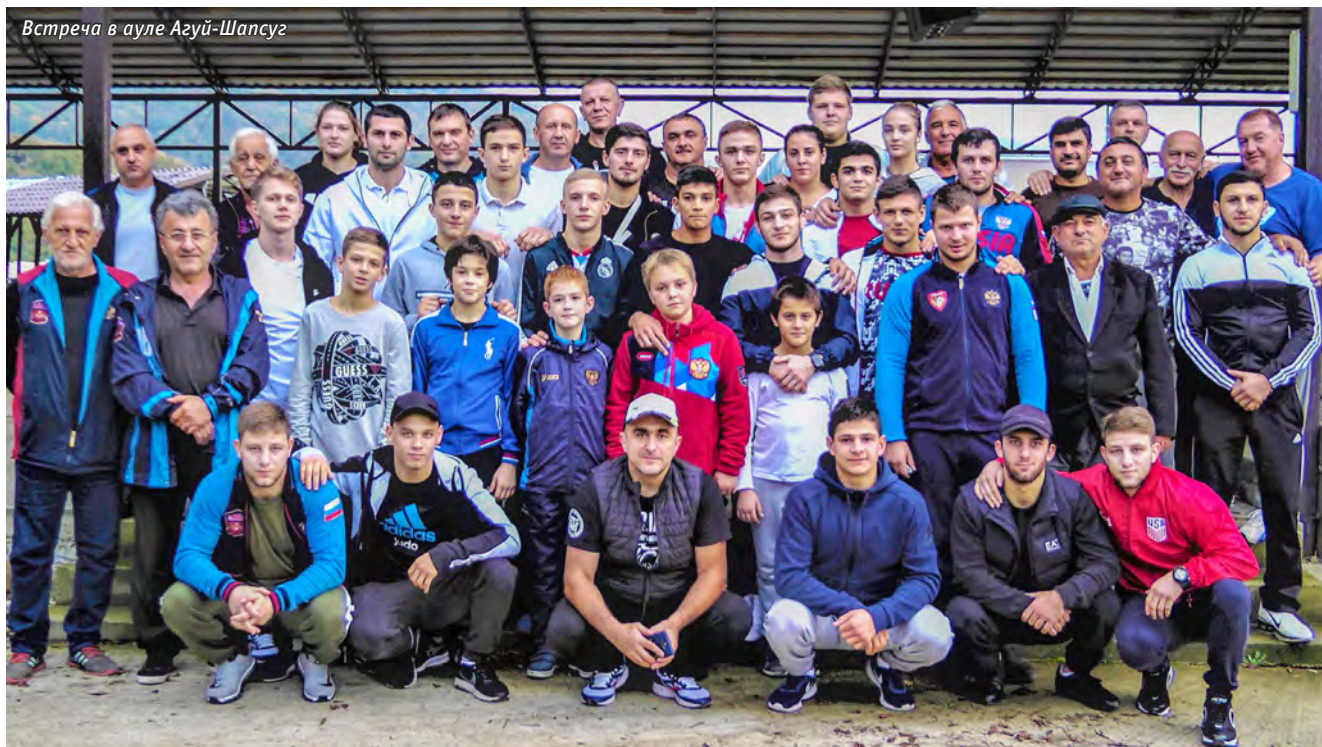
Встреча в ауле Азуй-Шансуз

— Твоя техника дзюдо не раз получала признание специалистов. Часто ли тебя приглашают на мастер-классы?