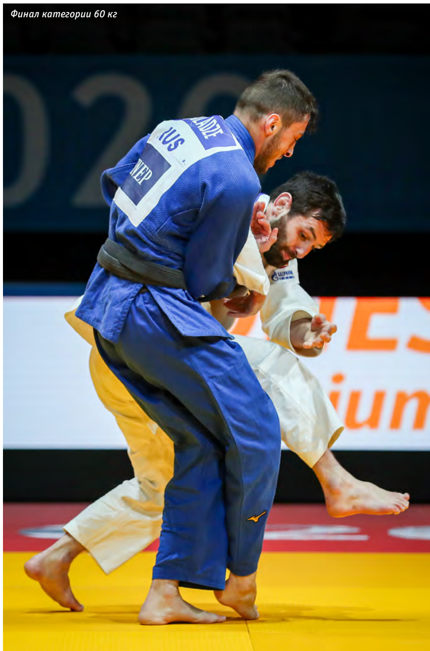
Финал категории 60 кг