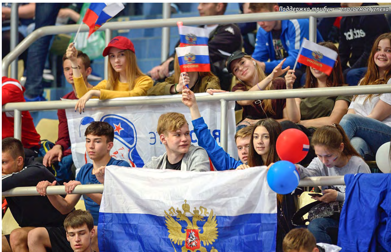
Поддержка трибун — залог успеха