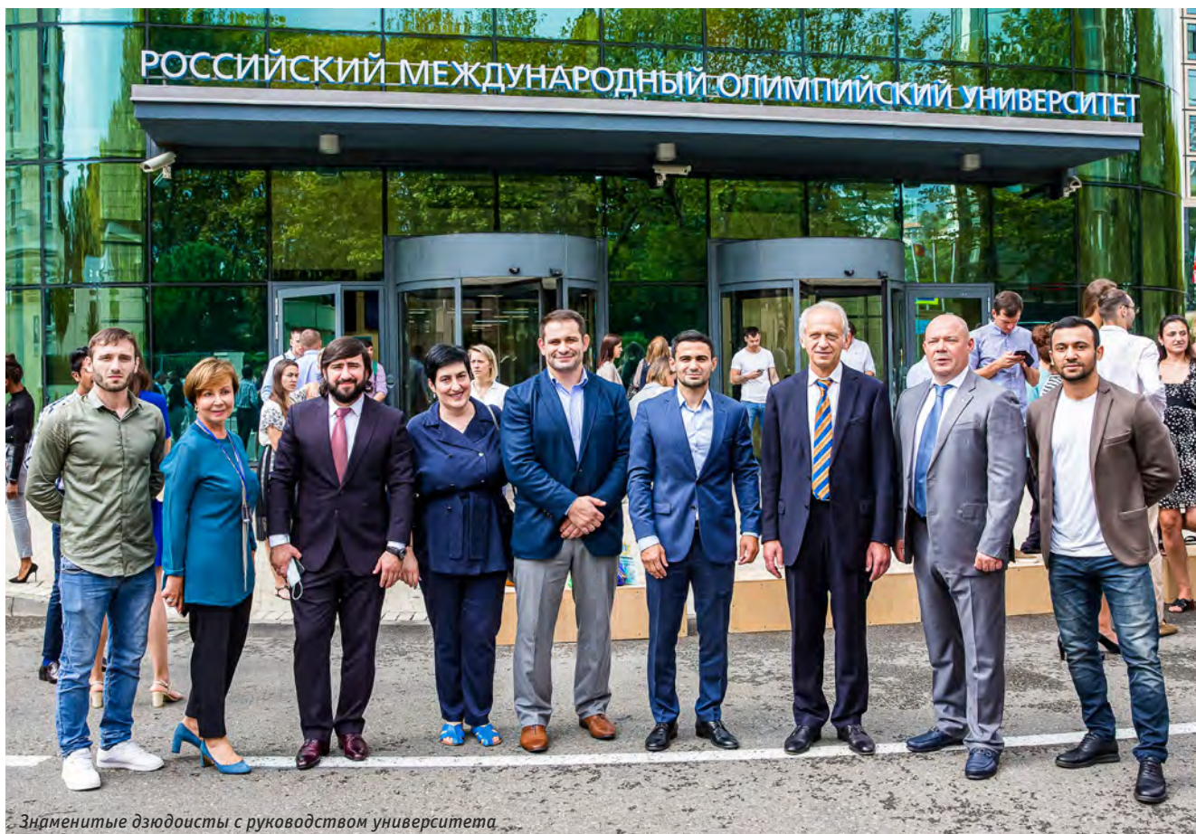
Знаменитые дзюдоисты с руководством университета