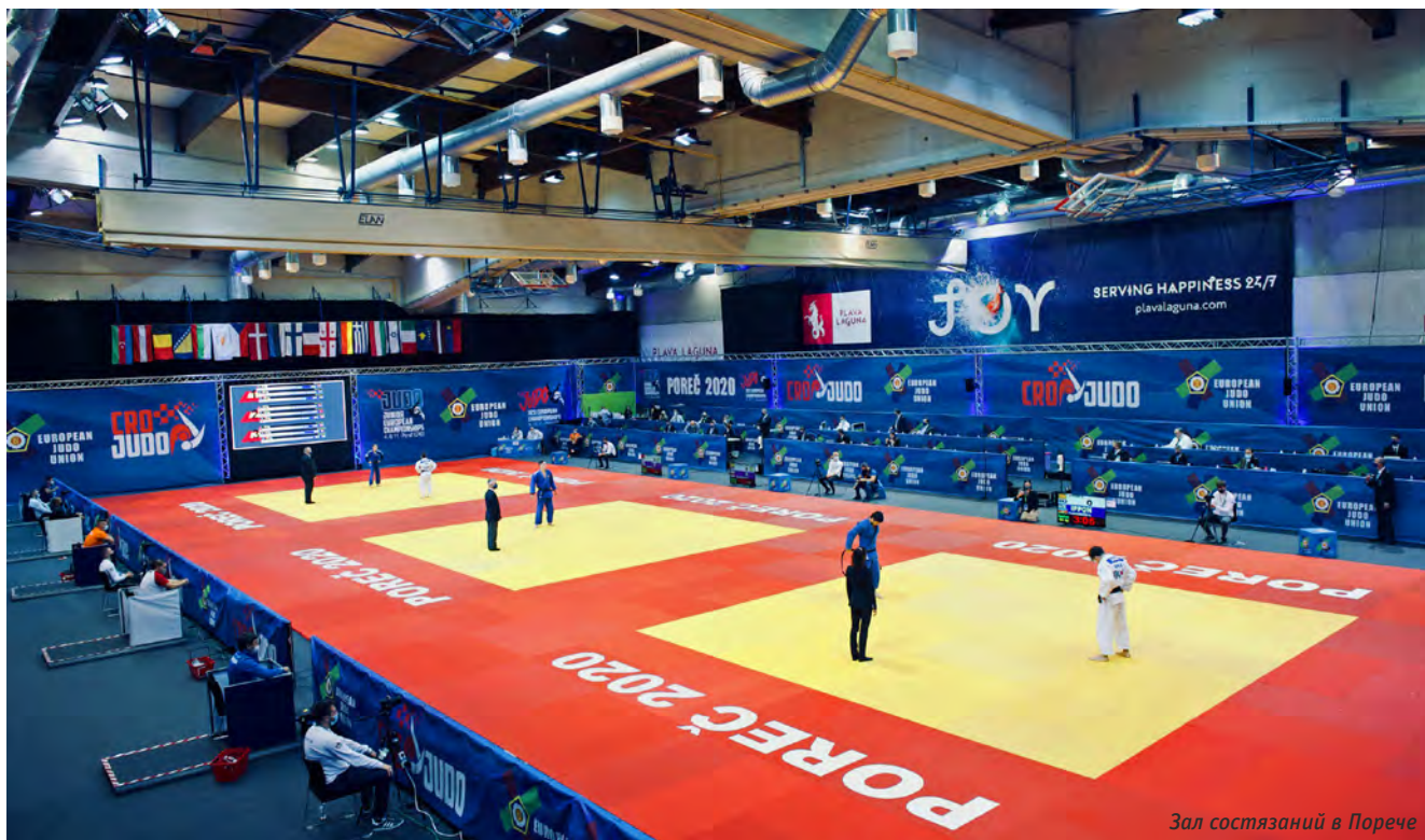
Зал состязаний в Порече