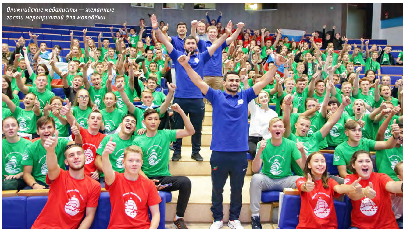
Олимпийские медалисты — желанные гости мероприятий для молодежи

Темой рубрики «Эмоции дзюдо» мы решили выбрать ту же, что была и темой Всемирного дня дзюдо-2020: «Сильнее вместе». Сегодня общество, разделенное вирусом, границами и масками, нуждается в спланированных идеях, делающих мир лучше. Наша сила — в единстве: идеалов, целей и самих людей, в дружной семье, в сильной команде, в мощной стране, в едином мире. Благодаря разработанной Дзигоро Кано системе, тот, кто выбирает гибкий путь, выбирает дорогу обучения, развития и самосовершенствования. Мы живем по принципам гуманизма, и ценности дзюдо объединяют нашу мировую семью в единое целое перед лицом глобальных угроз.