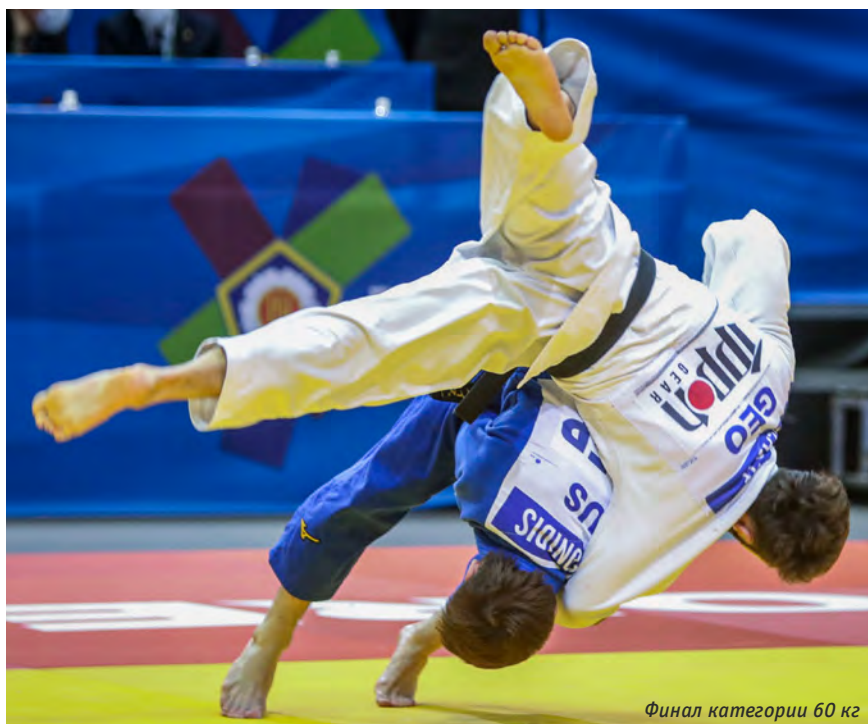
Финал категории 60 кг