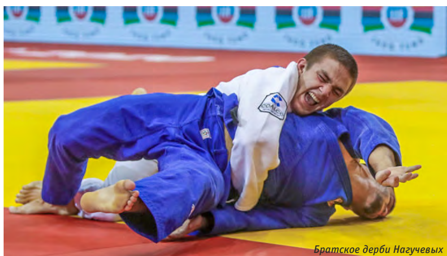
Братское дерби Нагучевых