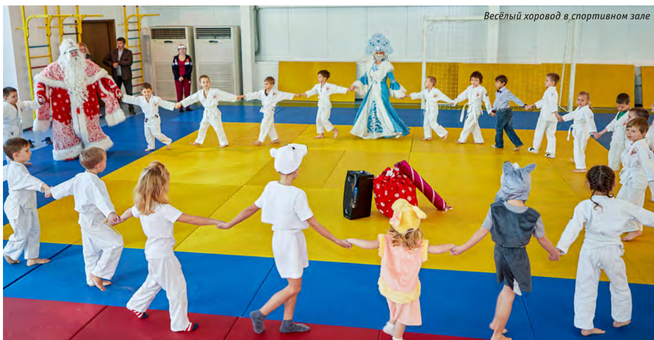
Весёлый хоровод в спортивном зале