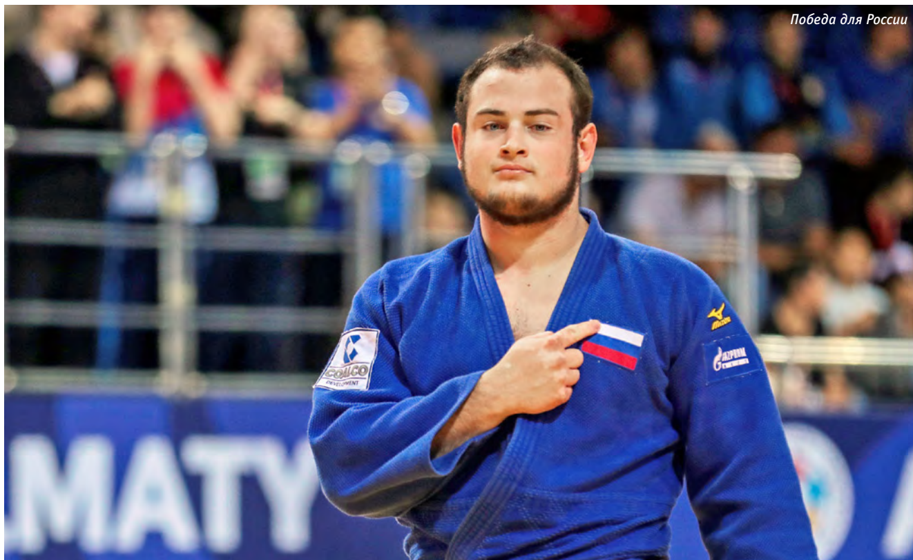
Победа для России