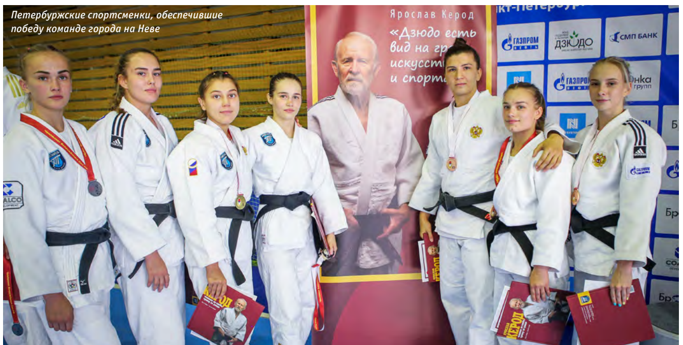
Петербургские спортсменки, обеспечившие победу команде города на Неае

РФ 8 июня 2019 года. Через четыре дня его не стало. Поэтому решение присвоить всероссийским военным стартам имя этого замечательного человека было логичным и закономерным шагом. По инициативе коллег и воспитанников Ярослава