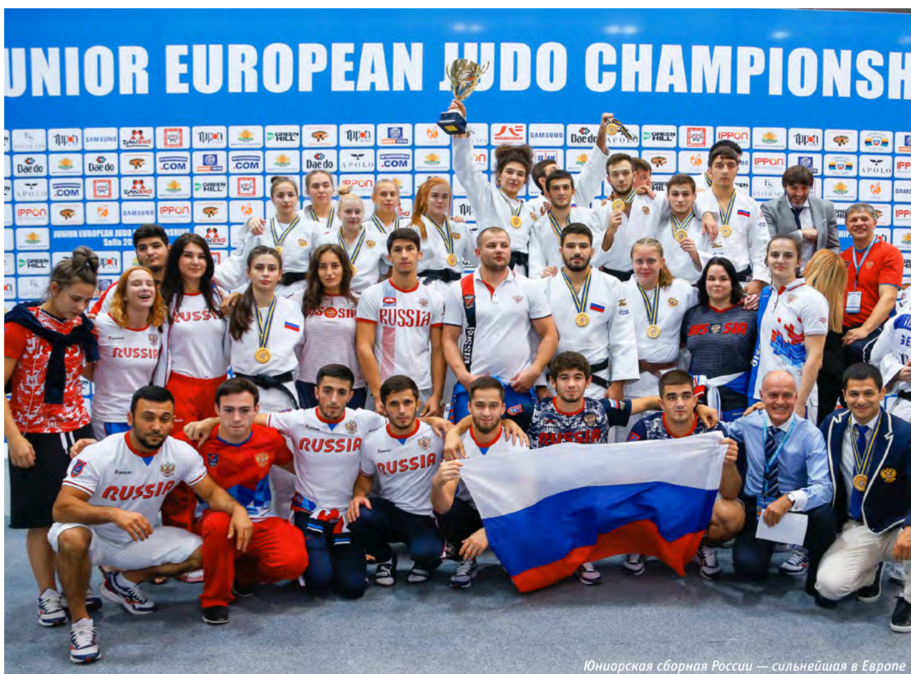
Юниорская сборная России — сильнейшая в Европе