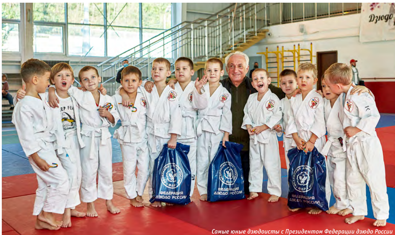
Самые юные дзюдоисты с Президентом Федерации дзюдо России