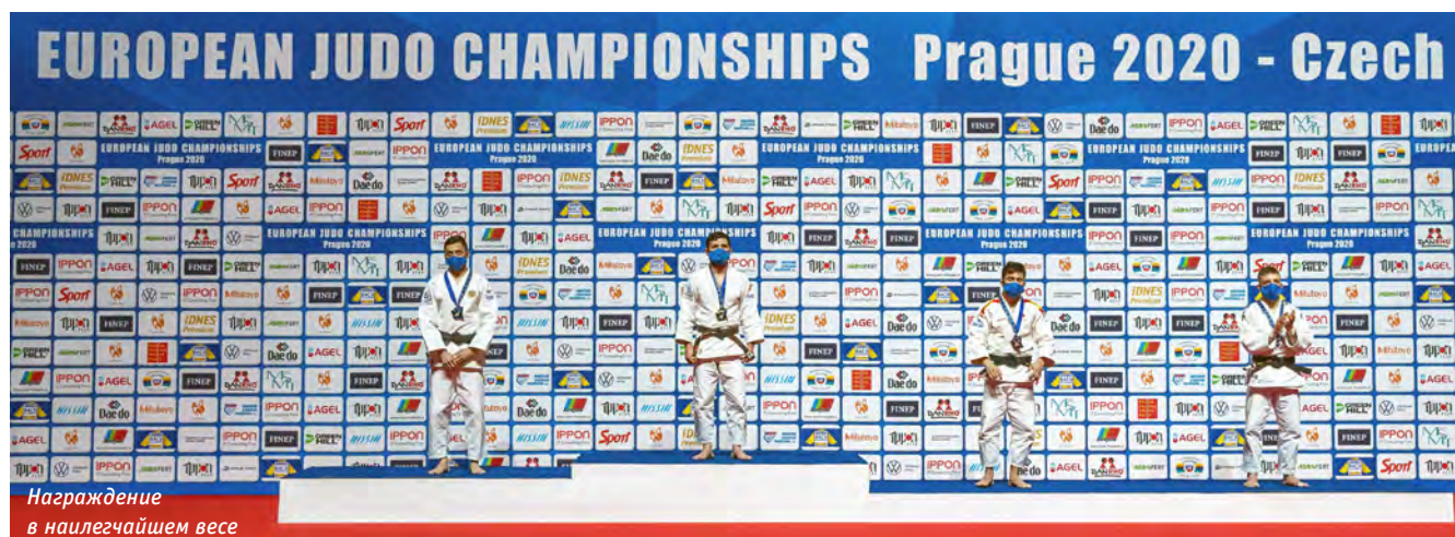
Награждение в наилегчайшем весе