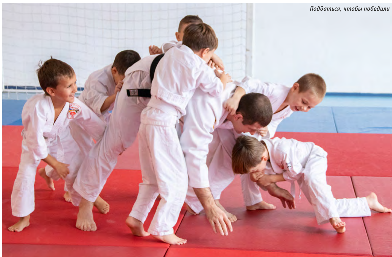
Поддаться, чтобы победили