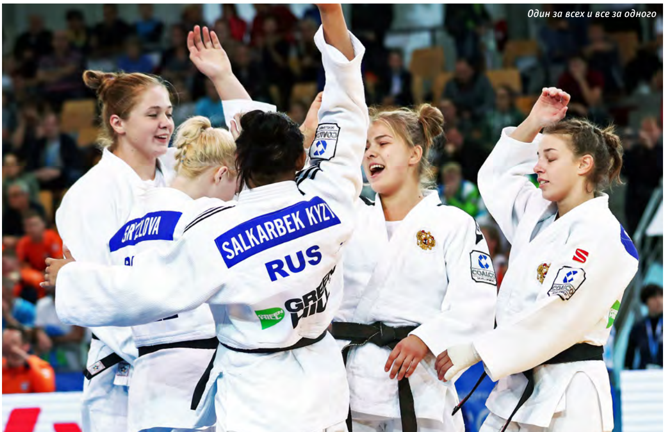
Один за всех и все за одного