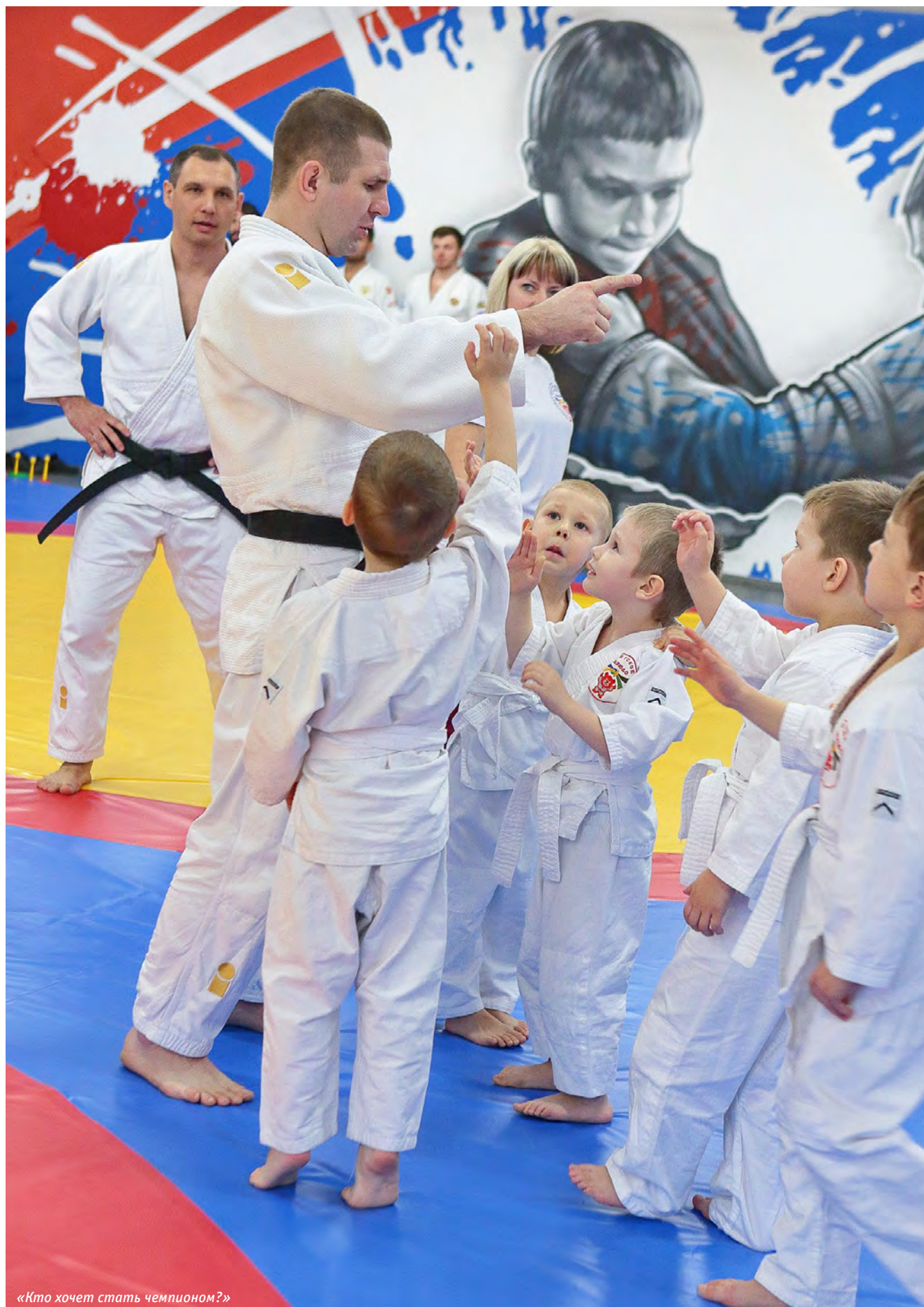
«Кто хочет стать чемпионом?»