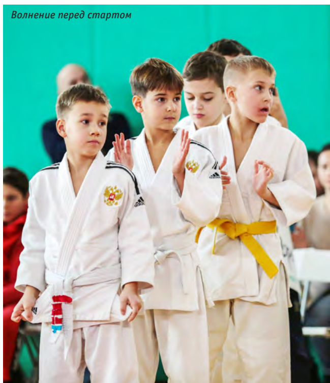
Волнение перед стартом

По мнению Сергея Соловейчика, эти сомнения оправданы, но их скоро удастся развеять. «Федера-