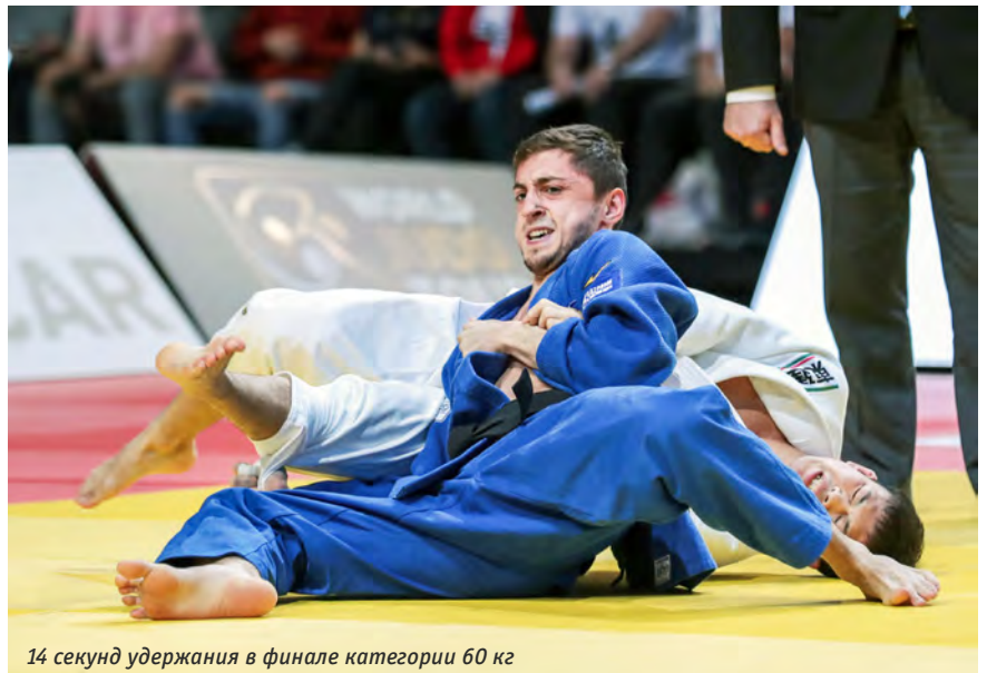
14 секунд удержания в финале категории 60 кг