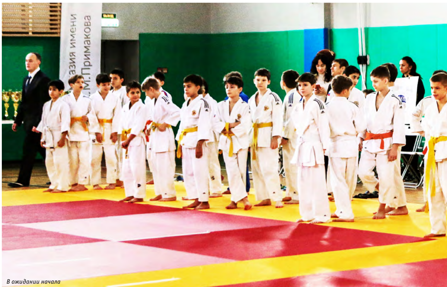
В ожидании начала

готовыми протянуть руку слабому. Уверен, что путь, а именно так переводится частица «до» в названии нашего вида спорта, вы-