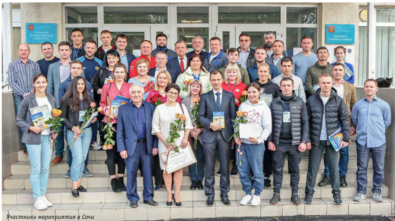
Участники мероприятия в Сочи