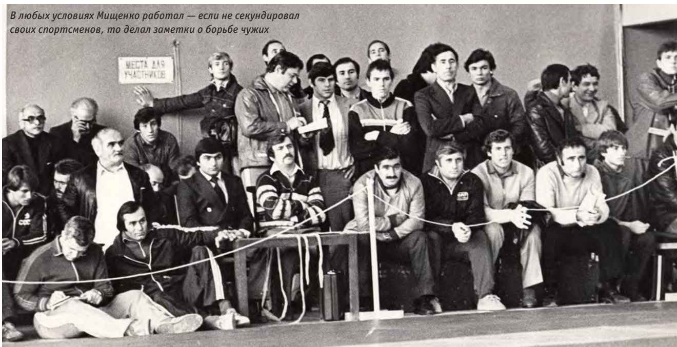
В любых условиях Мищенко работал — если не секундировал своих спортсменов, то делал заметки о борьбе чужих

В то время конкуренция в нашей сборной была жёсткая — по два-три человека в каждой весовой категории. Были определённые проблемы в команде. Володя