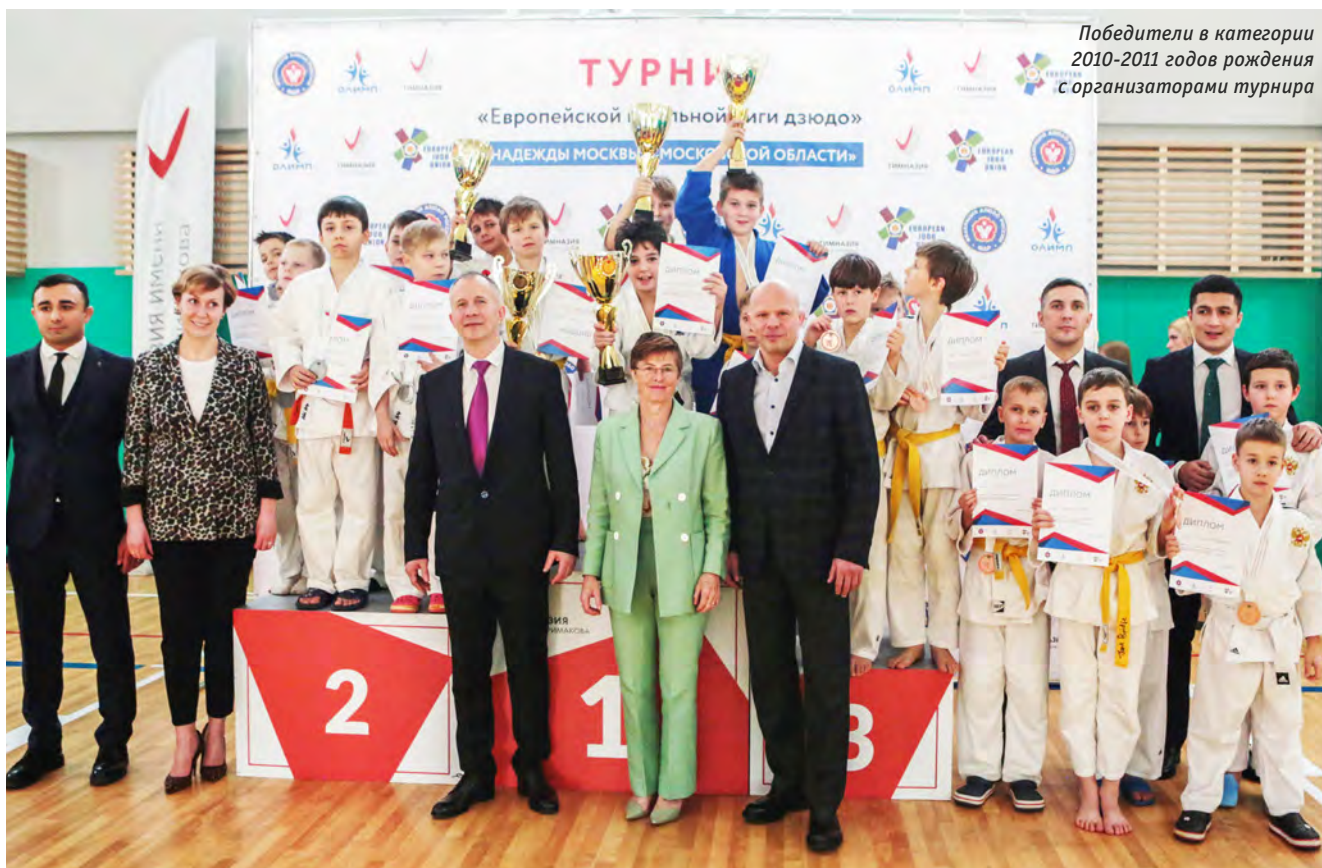
Победители в категории 2010-2011 годов рождения с организаторами турнира

да, что российские ребята в скором времени смогут выступить и на международных школьных стартах.