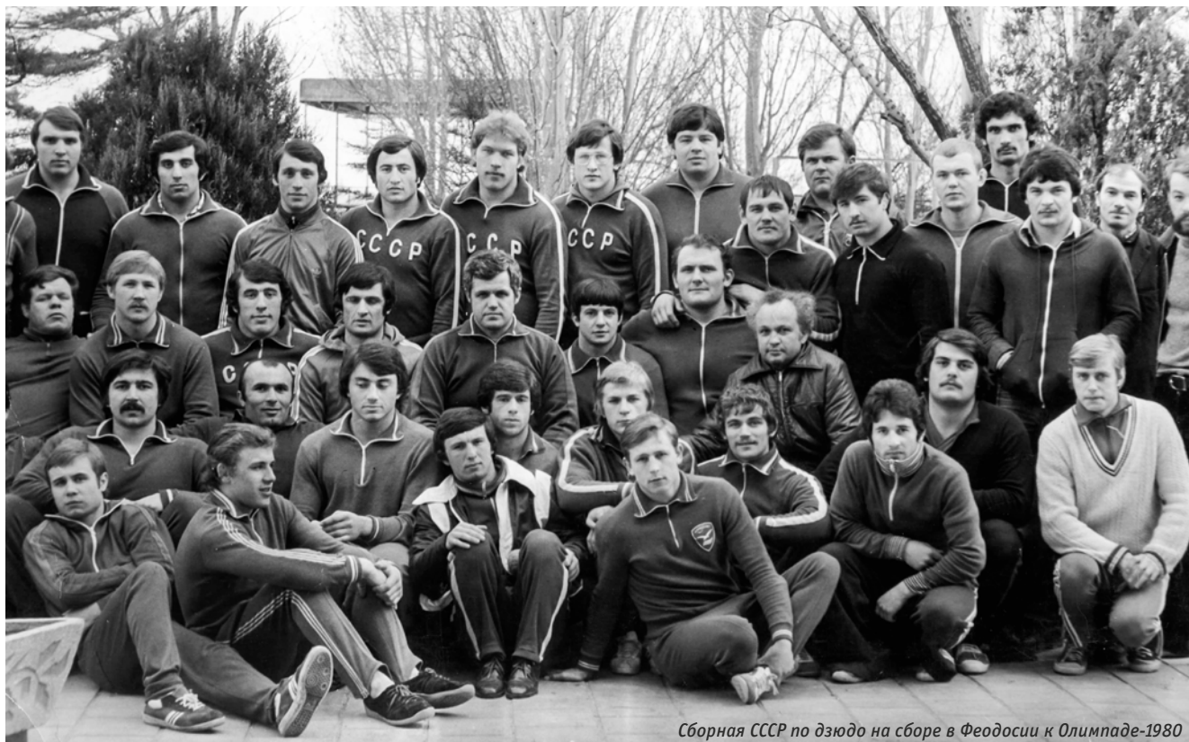
Сборная СССР по дзюдо на сборе в Феодосии к Олимпиаде-1980

Потом японцы скажут: «Зачем нам такая командная победа, если