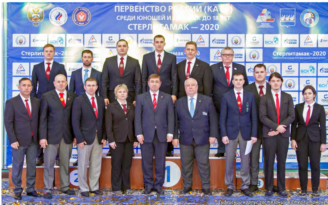
Судейский корпус состязаний в Стерлитамаке

Пензенской и Оренбургской областей. Большинство дзюдоистов показало высокий уровень технической подготовки, оставив положительные впечатления у членов судейского корпуса. Было разыграно два комплекта наград. В дисциплине