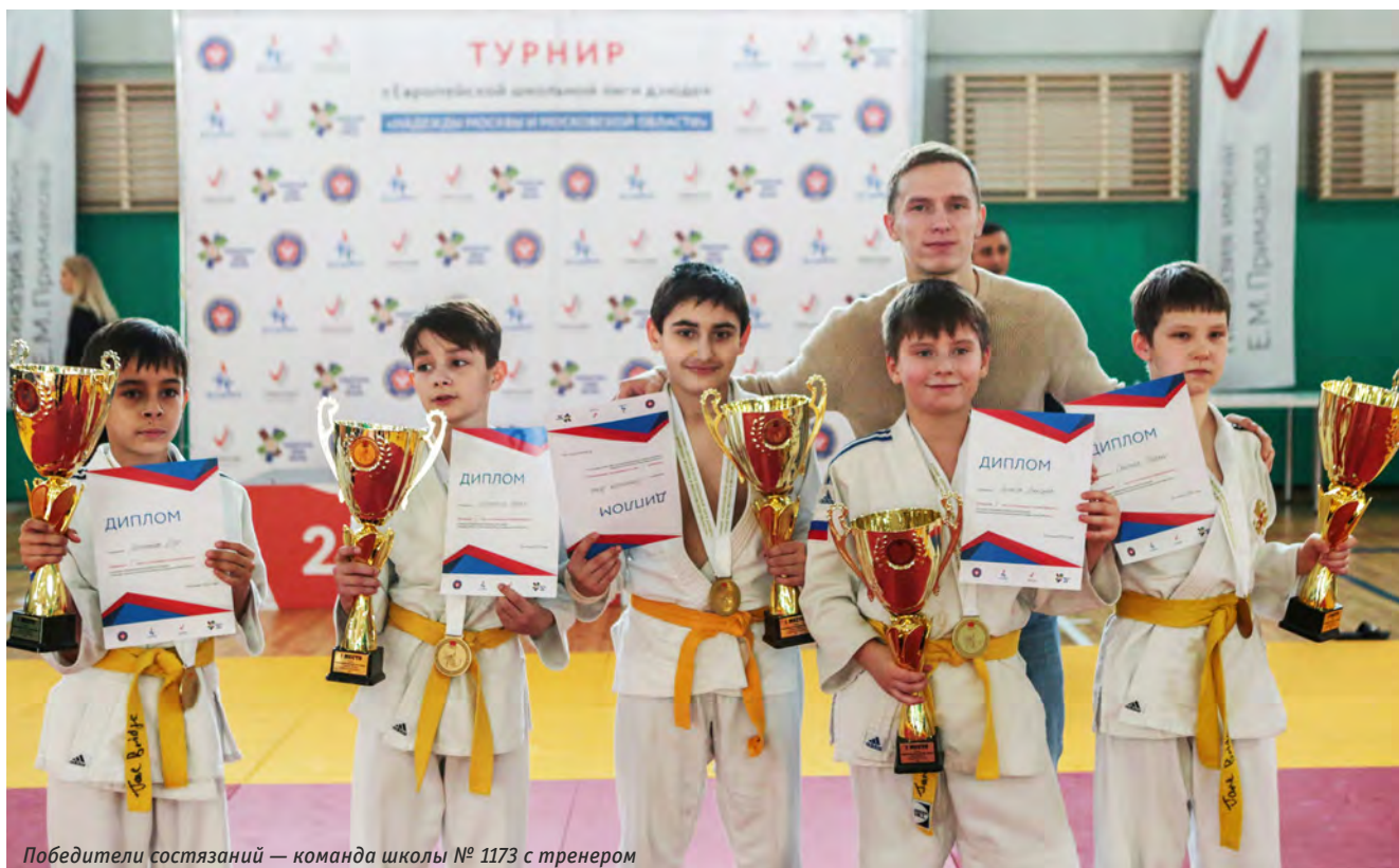
Победители состязаний — команда школы № 1173 с тренером