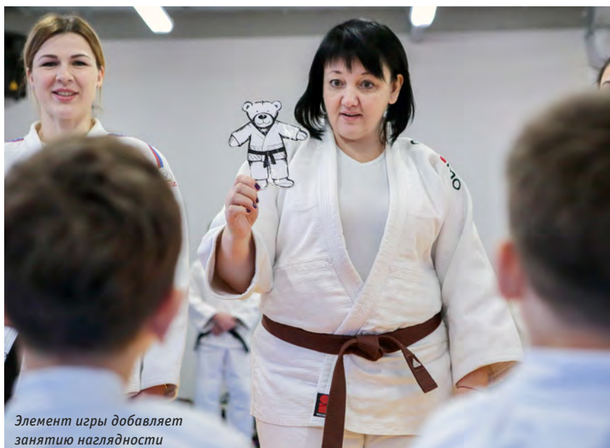
Элемент игры добавляет занятию наглядности