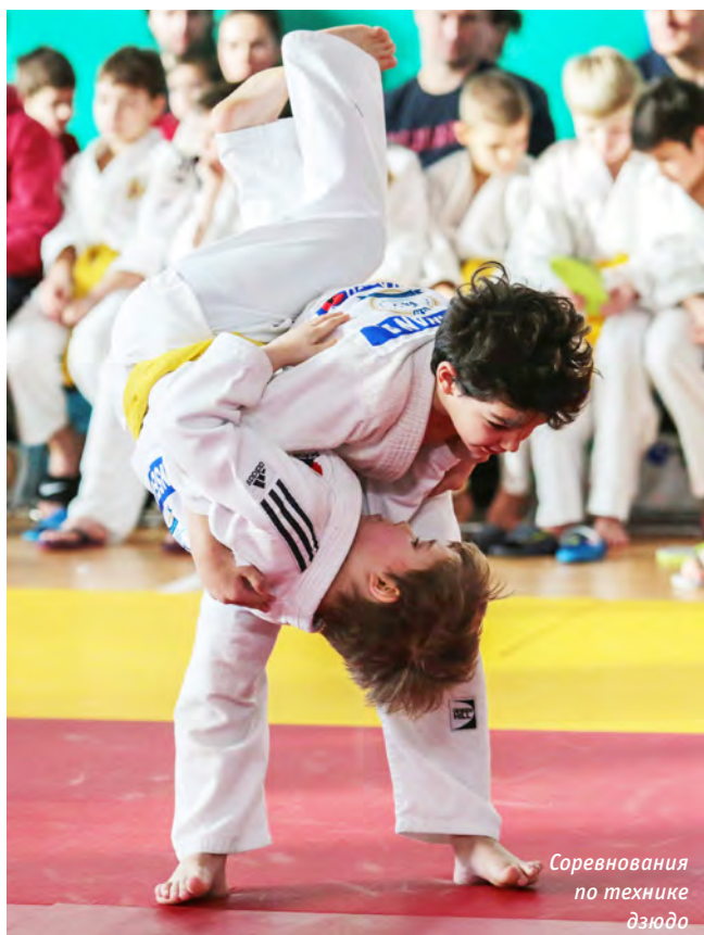
Соревнования по технике дзюдо