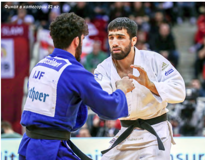
Финал в категории 81 кг