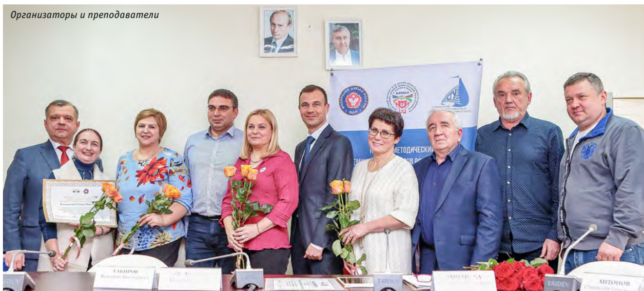
Организаторы и преподаватели