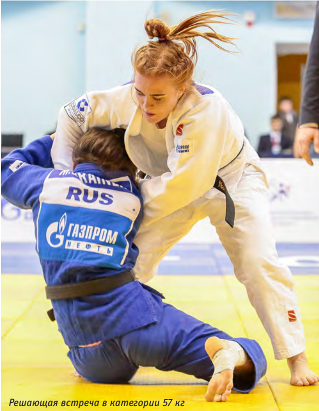
Решающая встреча в категории 57 кг