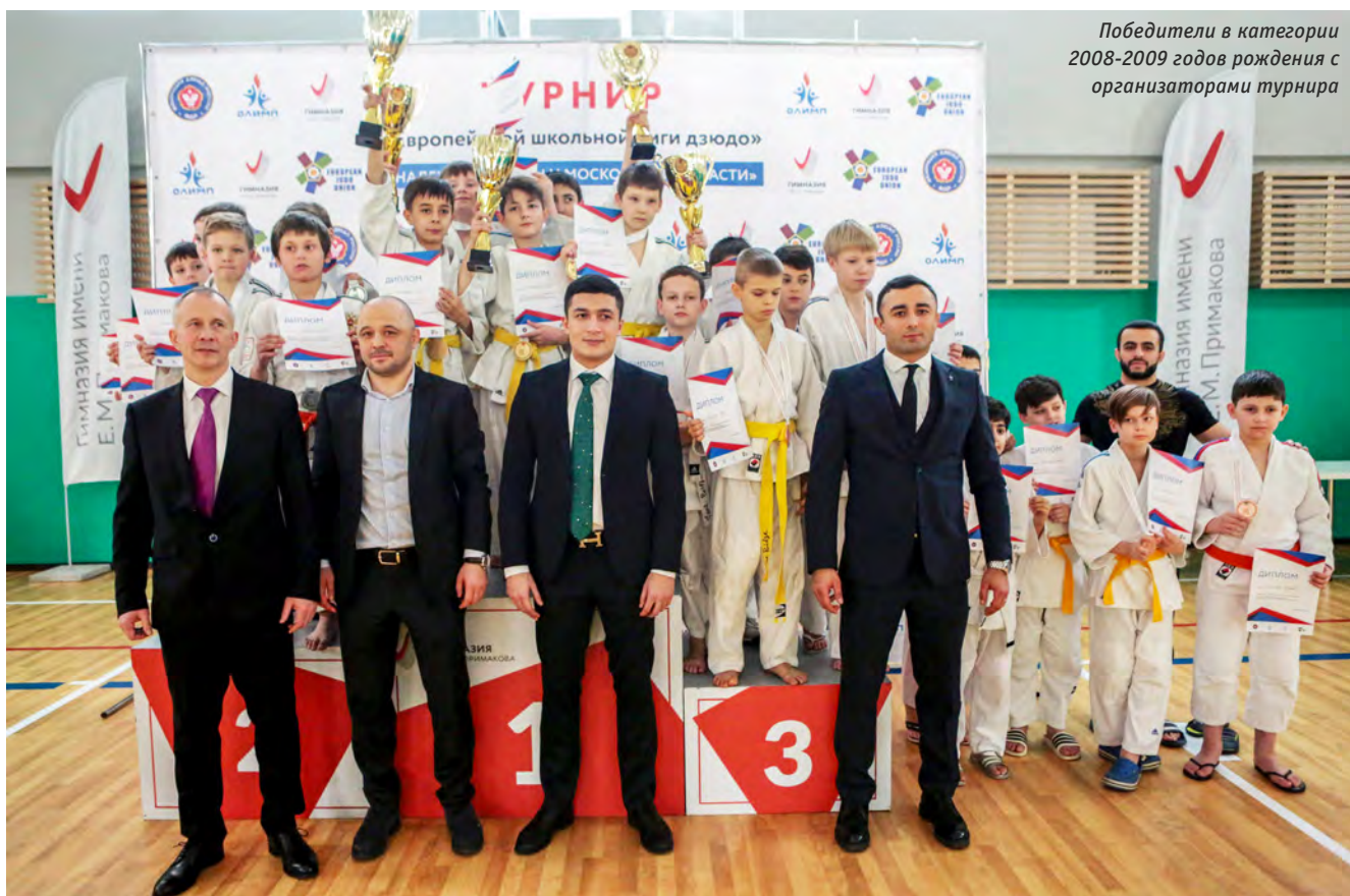
Победители в категории 2008-2009 годов рождения с организаторами турнира