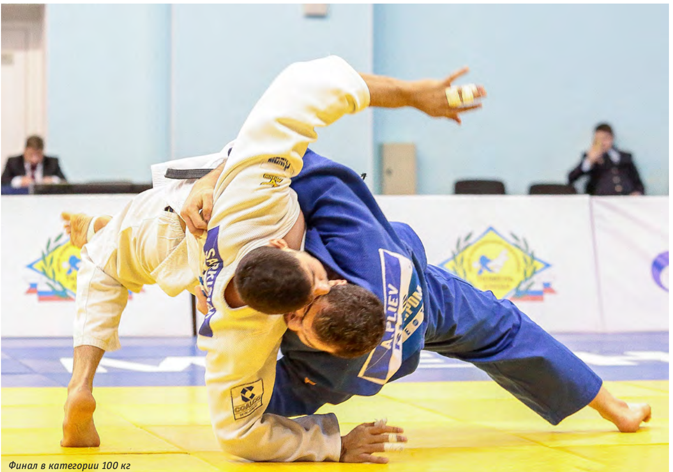
Финал в категории 100 кг

«Когда Азамат заработал «ваза-ари», я всё равно был уверен,