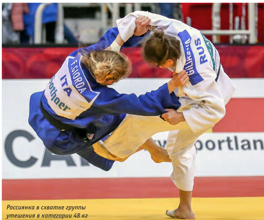
Россиянка в схватке группы утешения в категории 48 кг