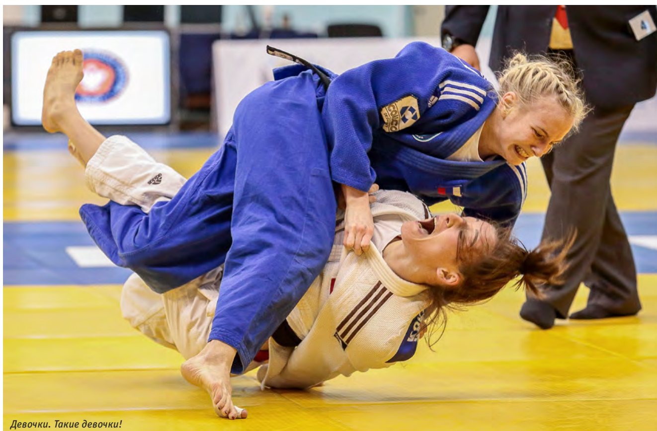
Девочки. Такие девочки!