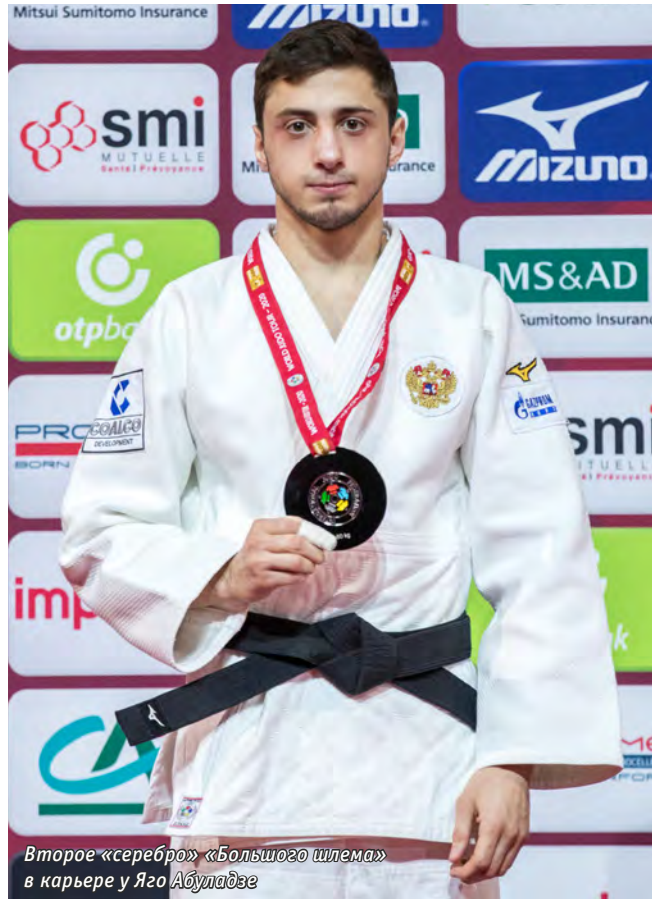
Второе «серебро» «Большого шлема» в карьере у Яго Абуладзе