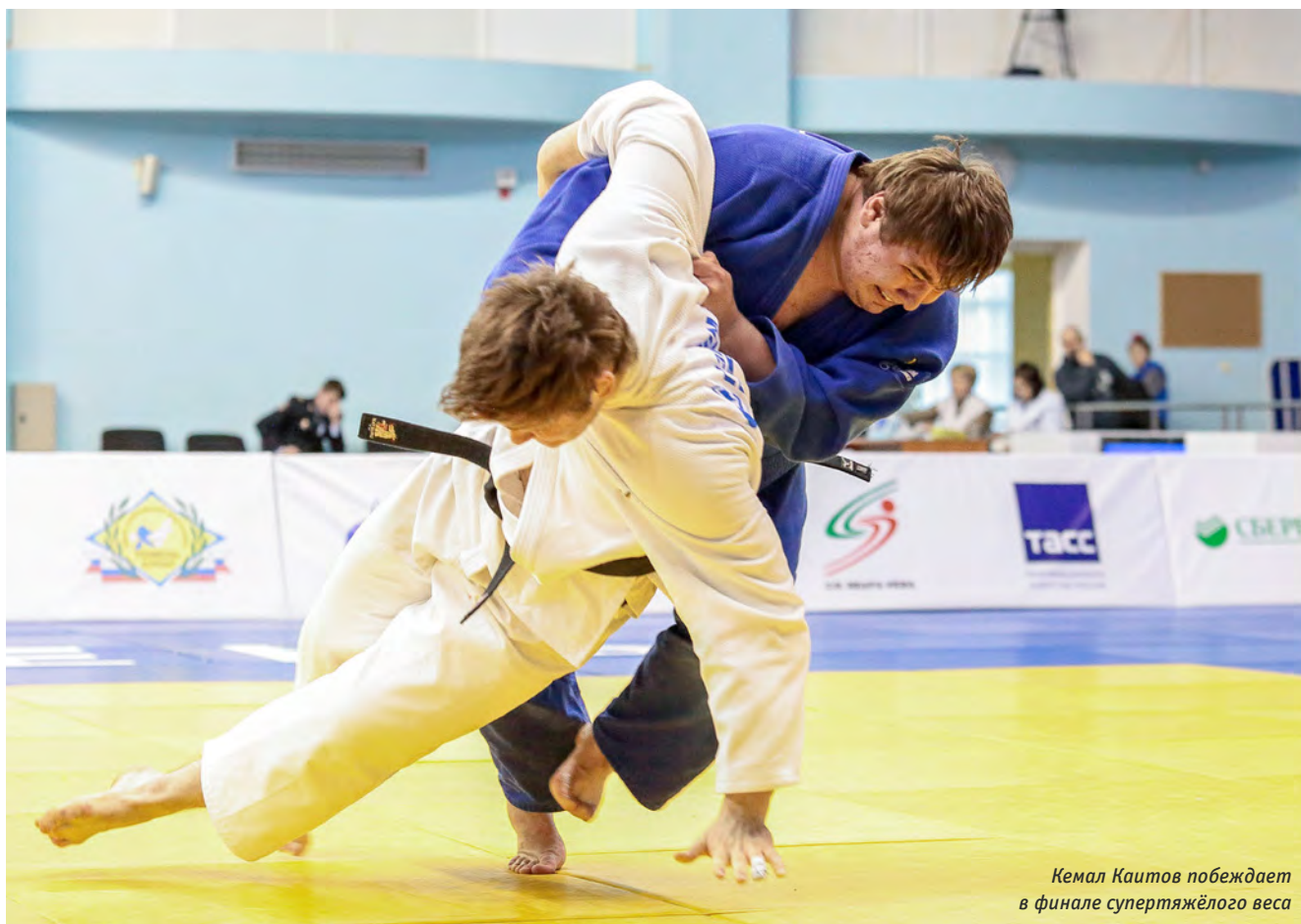
Кемал Каитов побеждает в финале супертяжёлого веса