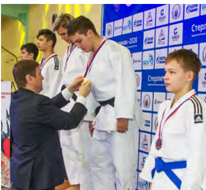
54. Первенство России по КАТА в Стерлитамаке