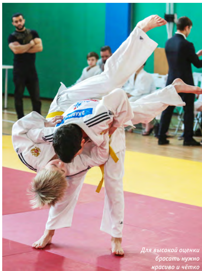
Для высокой оценки бросать нужно красиво и чётко