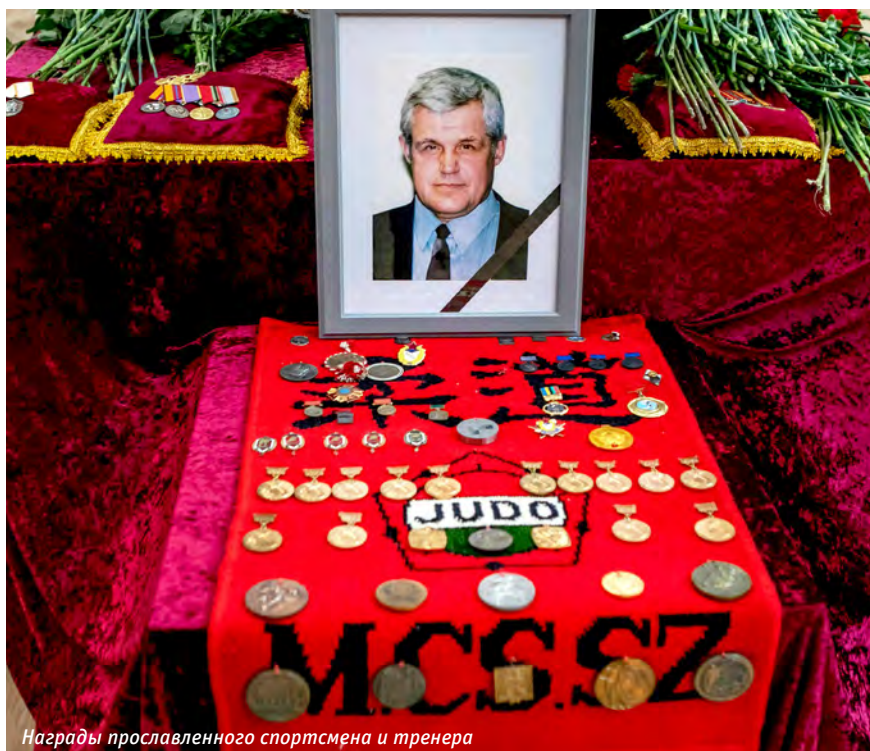
Награды прославленного спортсмена и тренера

смен может чего-то добиться, только выкладываясь полностью».