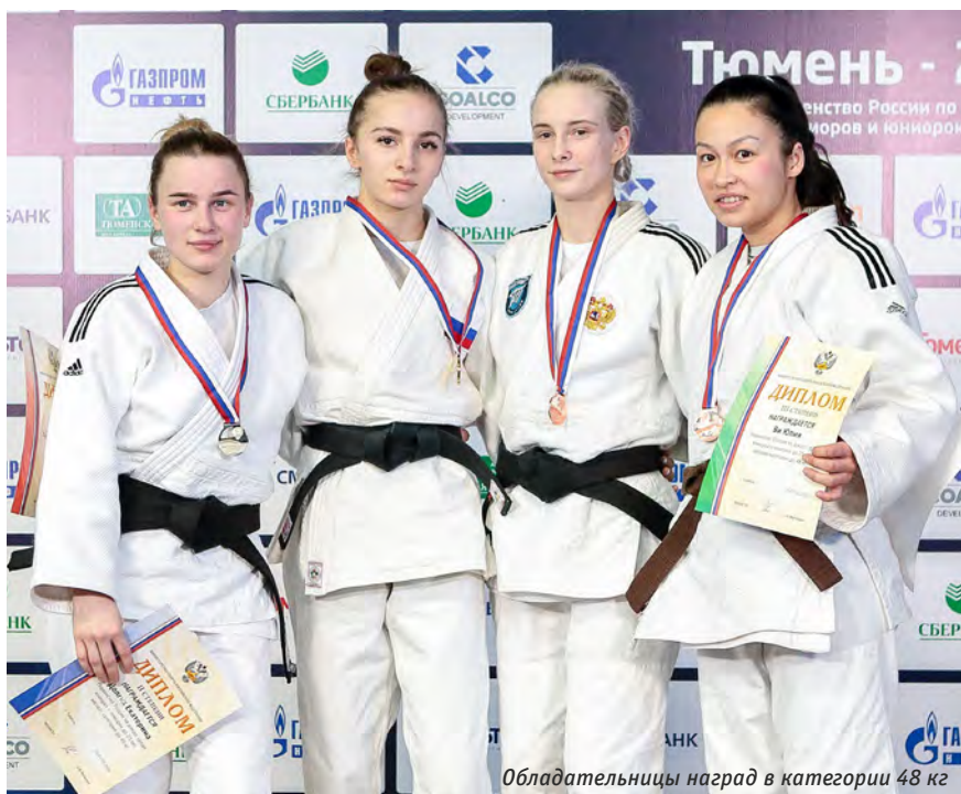
Обладательницы наград в категории 48 кг

На церемонии награждения Алина выглядела очень серьёзной: не было похоже, что она одержала победу.