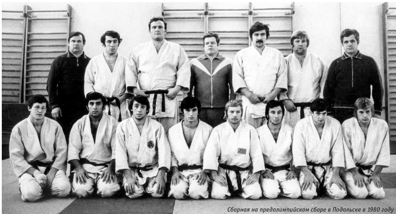
Сборная на предолимпийском сборе в Подольске в 1980 году