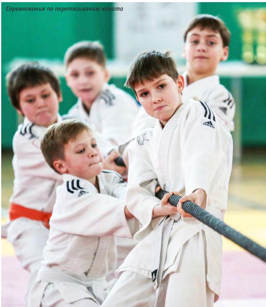
Соревнования по перетягиванию каната

ции дзюдо России эта задача по силам», — пояснил он.