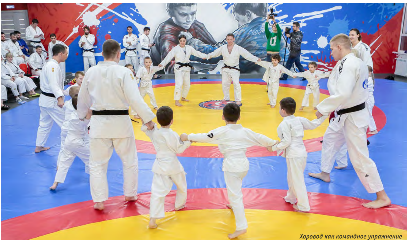
Хоровод как командное упражнение

«Уникальность семинара — в комплексном освещении темы дошкольного дзюдо, ведь для таких малышей общее физическое