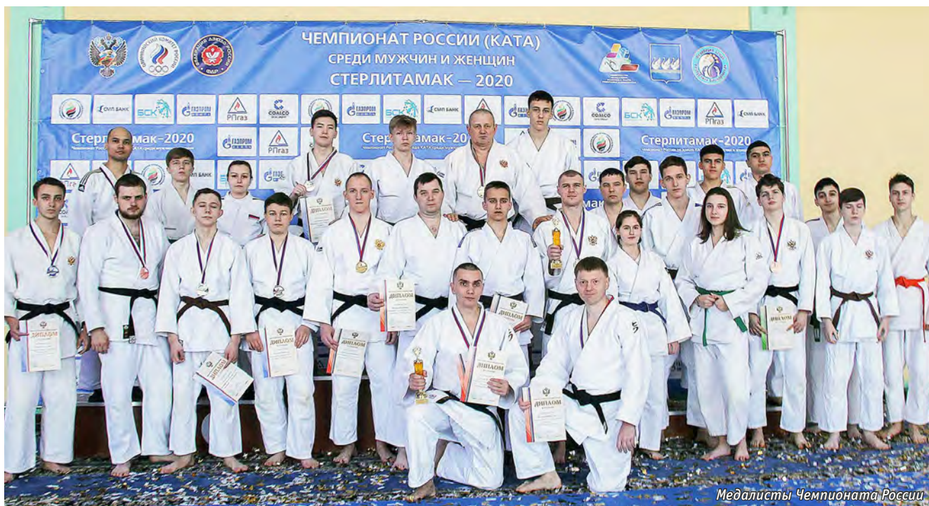
Медалисты Чемпионата России

подготовки и понимания принципов дзюдо растёт по всей стране».