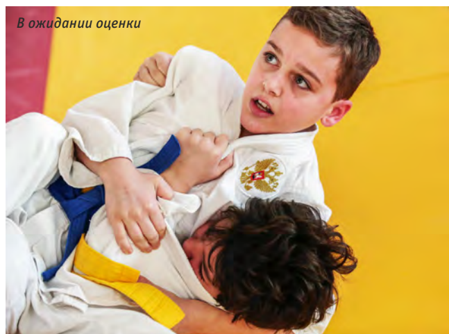
В ожидании оценки