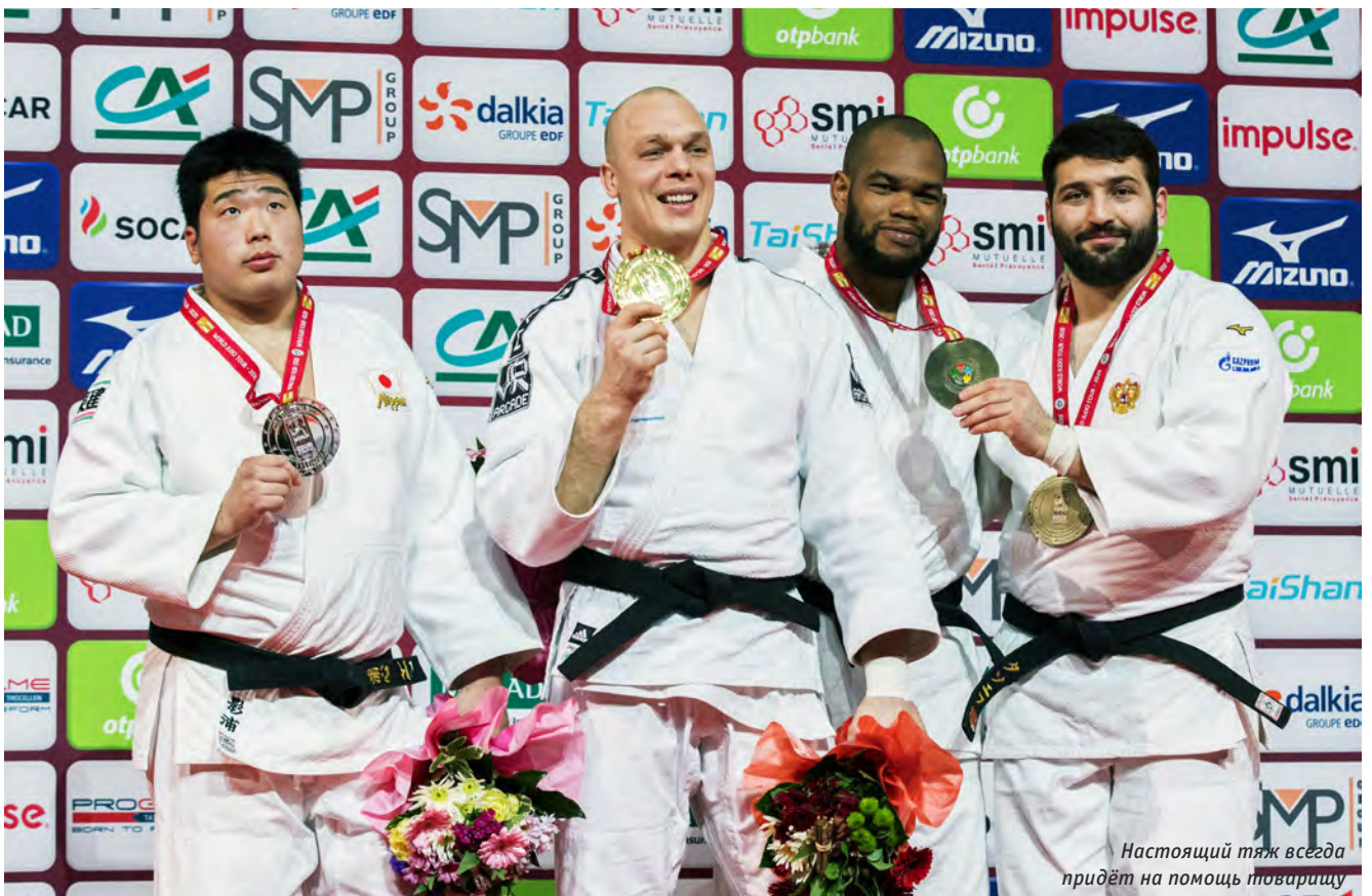
Настоящий тяж всегда придѣт на помощь товарищу