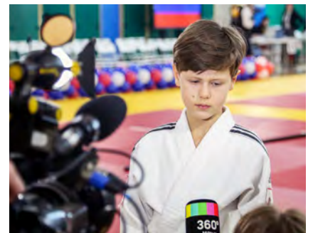
70. Европейская школьная лига дзюдо