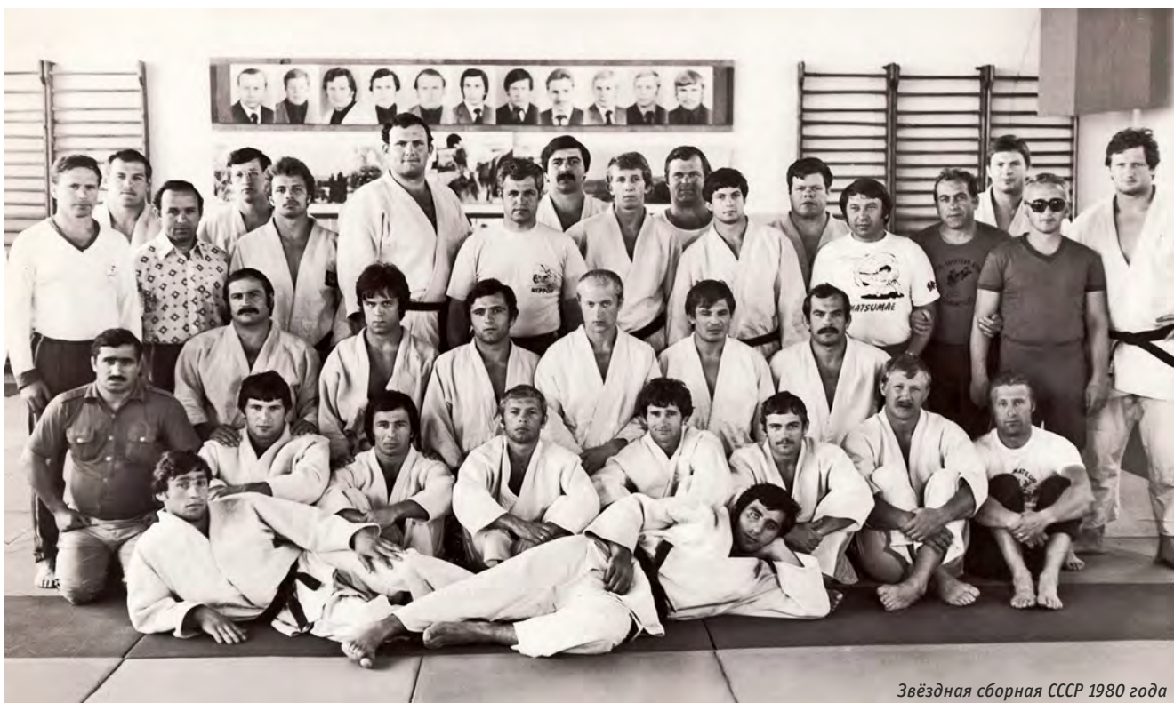
Звёздная сборная СССР 1980 года

Команда у нас была дружная, целеустремлённая, каждый перед собой ставил задачу добиться наилучшего результата. В советское время не признавалась никакая медаль, кроме золотой. Везде и всегда у нас должно было быть только «золото». Идеология такая была: это не просто навязывалось, а вбивалось в умы. Сами спортсмены это прекрасно понимали. Может быть, многие ребята из-за этого и не раскрылись. Достичь вершины сразу дано не каждому: кому-то надо набраться опыта, а на это необходимо время, которого не было. Поэтому особого давления со стороны руководства не было, потому