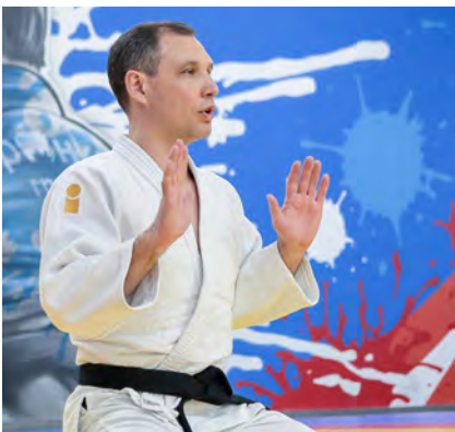
46. Тренерский семинар проекта детского дзюдо